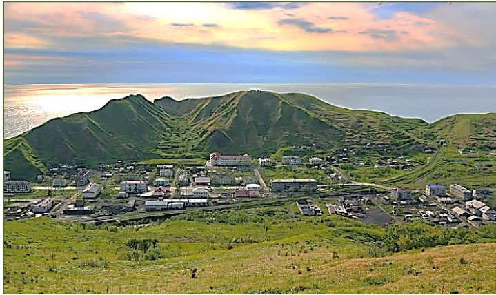
Село Чехов в устье реки Чеховки (о. Сахалин, Холмский городской округ).

Этот яркий штрих дивной природы представлен в его книге «Остров Сахалин», которую мы рассматриваем в данном случае как страноведческое издание. При этом Чехов широко применяет научный метод, называемый сравнительно-географическим [1, 2].