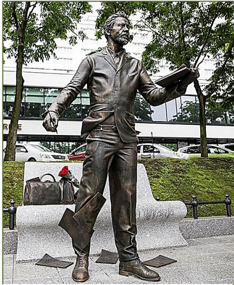
Памятник А.П. Чехову во Владивостоке.

Мы сравнили температуру в указанных местах с её современными значениями [3].